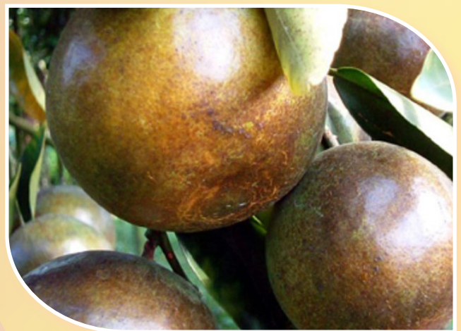
การเข้าทำลายของไรแดงแอฟริกัน

ตัวอ่อนและตัวเต็มวัยดูดกินน้ำเลี้ยงบริเวณหน้าใบ ในระยะเพลลาด โดยไม่สร้างเส้นใย หากทำลายรุนแรงอาจพบได้ทั้งบน ใต้ใบ และผลส้ม ใบที่ถูกทำลายจะมีสีจางลง และมักพบคราบเก่าของไรแดงสีขาวคล้ายฝุ่นเกาะบนใบ ส่วนผิวส้มที่ถูกทำลายจะเป็นรอยประสีจางๆ กระจายอยู่ทั่วไป ถ้าทำลายรุนแรงและต่อเนื่องช่วงผลเล็ก ทำให้ผลหลุดร่วงพบระบาดในช่วงที่ฝนเริ่มทิ้งช่วง อากาศแห้งแล้ง และมีลมพัดแรง โดยพบมากในช่วงเดือนธันวาคม-มกราคม จากนั้นจะค่อยๆ ลดลง และพบมากอีกครั้งในช่วงเดือนมีนาคม-เมษายน ซึ่งแล้งจัด และพบระบาดน้อยมากในช่วงฤดูฝน