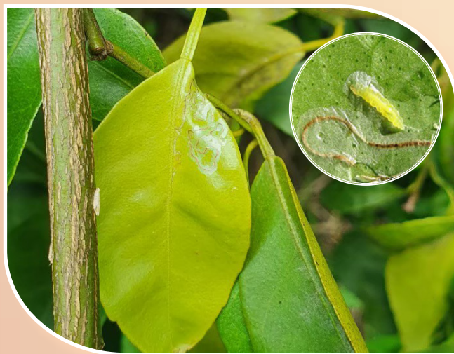
ตัวอ่อนและลักษณะการทำลายของหนอนชอนใบ