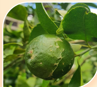
ตัวอ่อนและลักษณะการทำลายของเพลี้ยไฟพริก