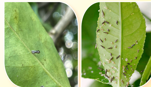
การเข้าทำลายของเพลี้ยไค้แจ้ส้ม