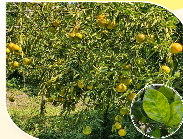
โรคกรีนนิง