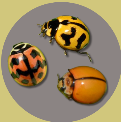
ด้วงเต่าลาย