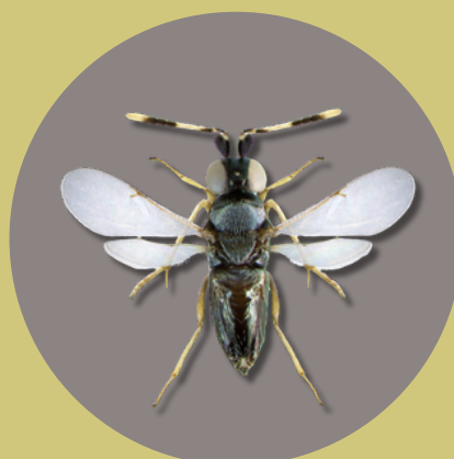
แตนเบียน วงศ์ Encyrtidae