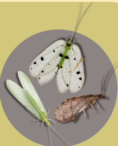
แมลงช่างปีกใส