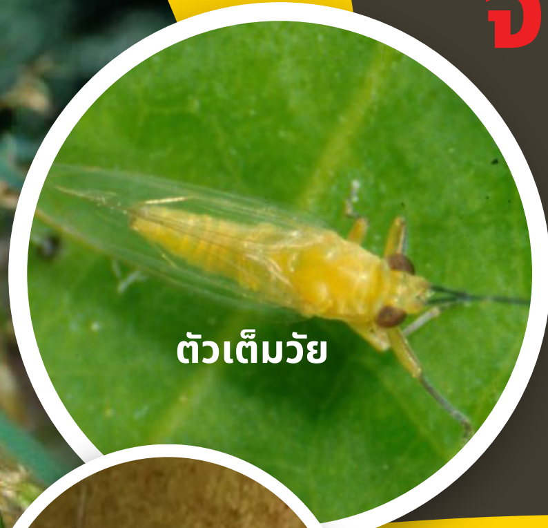
ตัวเต็มวัย